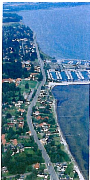
De ældste kloakrør i kommunen er ca. 100 år gamle.