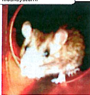
Rotter uden for kloakken? - så er der måske en utæthed i dit kloaksystem.

Det er ikke nok at være handyman, hvis du vil ændre på dit kloaksystem. Det kræver autorisation som kloakmester. Ring derfor til et VVS-firma. Kloakmesteren hjælper med at indhente tilladelse fra kommunen.