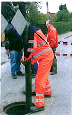
Kommunen står for anlæg, drift og vedligeholdelse af det offentlige kloaknet.

Vi tilstræber at reparere kloakrørene, inden de bryder sammen. Det er billigst på lang sigt og giver samtidig den bedste planlægning af det praktiske arbejde.