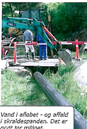
Vand i afløbet - og affald i skraldespanden. Det er godt for miljøet.

Kloakdæksler skal være tilgængelige. Det duer ikke, at du eller VVS-manden skal til at bryde asfalt op eller fjerne fliser eller en halv brændestabel for at komme til kloakken.