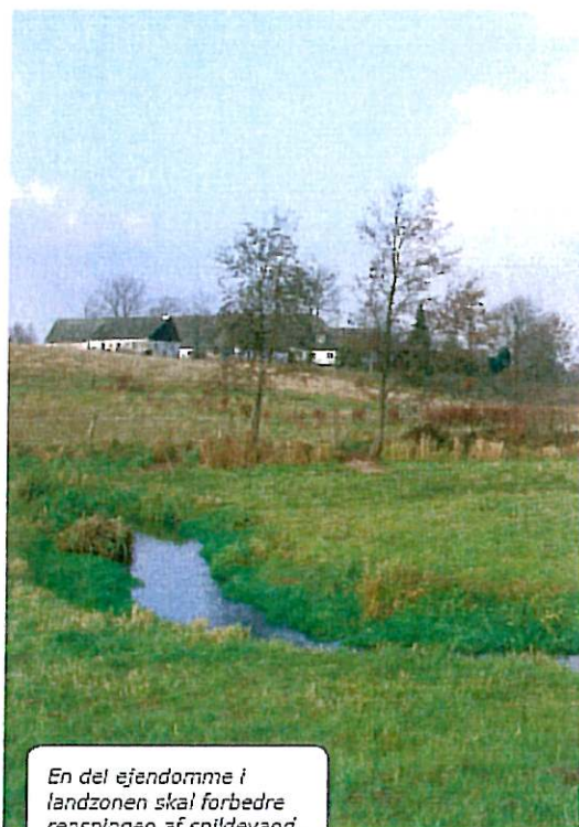
En del ejendomme i landzonen skal forbedre rensningen af spildevand.

Grundejeren kan også selv vælge at forbedre sit anlæg. Det kan typisk ske ved at etablere et nedslivningsanlæg efter bundfældningstanken. Her betaler grundejeren alle udgifter, både til anlæg, drift og vedligeholdelse. Etablering af nedslivningsanlæg kræver tilladelse fra kommunen.