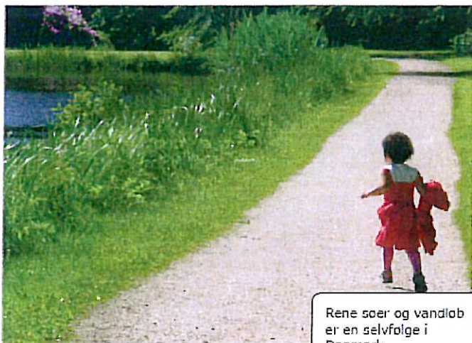
Rene søer og vandløb er en selvfølge i Danmark.

Selv om din ejendom er slut- tet til det offentlige kloaknet, har du selv ansvaret for drift og vedligeholdelse på din egen grund.